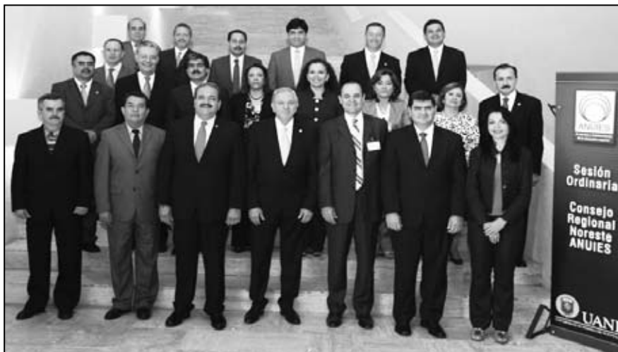
En la reunión se autorizó el dictamen de ingreso del Instituto Tecnológico de Ciudad Valles a la región noreste de la ANUIES

En la reunión se autorizó el dictamen de ingreso del Instituto Tecnológico de Ciudad Valles a la región noreste de la ANUIES para que el Consejo Nacional apruebe su ingreso. También se dio entrada a la solicitud de ingreso a la región del Instituto Potosino de Investigación Científica y Tecnológica, así como a la creación de la Red Nacional de Servicio Social. | C |