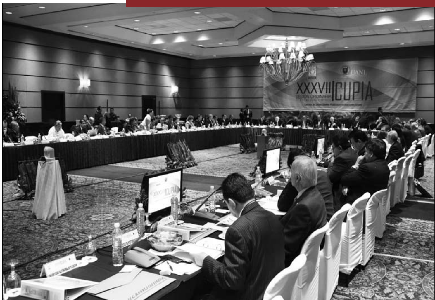
Entre los temas que se debatieron en la reunión del CUPIA destacaron la negociación del presupuesto de egresos 2012

El Secretario General Ejecutivo de la ANUIES precisó que esta propuesta contempla el proyecto de presupuestos plurianuales, de la que se espera logre el consenso de los distintos grupos políticos porque permitirá garantizar a las instituciones la posibilidad de planear de foma anticipada en el mediano y largo plazo.