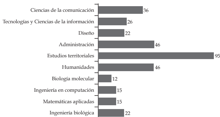
Gráfica 2 Total de temas relacionados directa o parcialmente con la sustentabilidad contenidos en los Planes de Estudio de la UAM-C